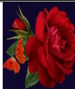
ادامه صفحه آخر