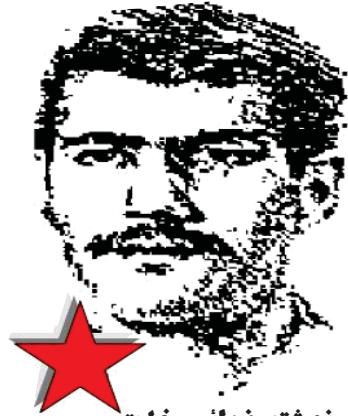
نوشته فدائی خلق