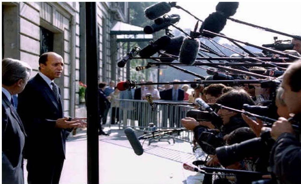
فابیوس اظهارات کارشناسان را تهمت و افترا می‌نامید.

با این که استادان علوم پزشکی در مصاحبه‌های متعدد رادیویی و تلویزیونی از دیدگاه علمی و فنی دولت فابیوس را به دلیل این رسوایی بزرگ متهم به سهل‌انگاری و سرزنش می‌کردند اما فابیوس گفته‌های آنها را تهمت و افترا می‌نامید. در حالی که روزانه ده‌ها نفر از مبتلایان به ایدز و هپاتیت در اثر تزریق خون‌های آلوده فرانسوی در خود این کشور و کشورهای مختلف جهان جان خود را از دست می‌دادند فابیوس خود را مشغول بحث و جدل با شرکت‌های بیمه کرده بود تا از زیر بار پرداخت غرامت به قربانیان شانه خالی کند! در واقع قربانیان بسیاری وجود داشتند که حتی قبل از این که ارتباط بیماری ایدز و هپاتیت آنها با خون‌های آلوده فرانسوی تایید شود جان خود را از دست داده بودند.