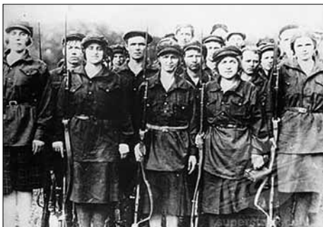
انقلابیون مسلح در جنگ داخلی