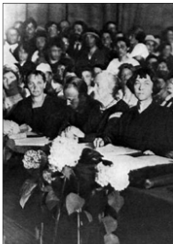
در کنار کلارا زتکین در کنفرانس بین الملل

سال ۱۹۰۶ نوشتن در این مورد را آغاز کرد. سال ۱۹۰۷ به همراه برخی از زنان هم فکرش اولین کلوپ زنان کارگر را ایجاد کرد. به علاوه دست اندر کار تهیه کتابی تحت عنوان «پایه های اجتماعی مسئله زن» شد. کتابی تحقیقی که در آن به مبارزه برای استقلال اقتصادی زنان، مشکلات ازدواج و خانواده و لزوم حمایت از زنان باردار و مادران جوان و مبارزه برای حقوق سیاسی زنان پرداخت. کلنتای با وجود این که برای دنیایی متفاوت مبارزه می کرد مخالف امکان بهبود قسمی زندگی زنان در چارچوب سیستم حاضر نبود و معتقد بود که زنان هر حقی