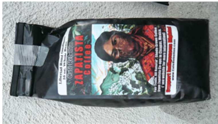
قهوه محصول زاپاتیست ها: عاری از مواد شیمیایی

یکی دیگر از اقدامات آنان، تاسیس یک بانک مردمی خود مختار زاپاتیستی (Banpaz) در "جنگل لاکاندون" است که از آن، به عنوان یک پروژه ی ضد سرمایه داری نام برده می شود و بنا به تصمیم اهالی محل، به اجرا درآمده است. پس از اجرای این برنامه ها، میزان فرار از مدرسه، سوء تغذیه و مرگ و میر کودکان، که پیش از سال ۱۹۹۴ در مقایسه با سایر نقاط کشور به بالاترین سطح رسیده بود، رو به کاهش نهاده است. بخش زنان جنبش از سال ۱۹۹۳ خواستار اجرای سختگیرانه "قانون ترک الکل" بوده است. پس از اجرای این قانون، از میزان اعتیاد به مشروبات الکلی کاسته شده است.