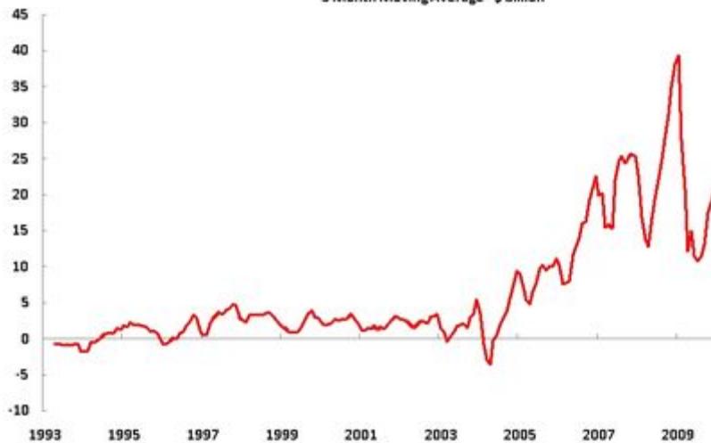
China - Monthly Trade Balance 3 Month Moving Average - $ billion